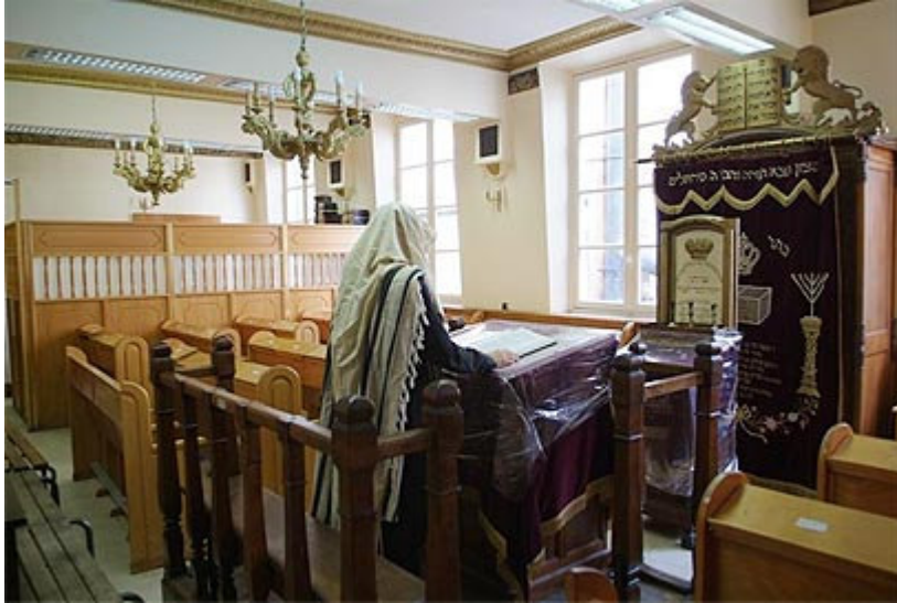
בית-כנסת? גם הולך

באוהל 'יזכור' ביד ושם. באותה תקופה ביקש וקיבל אישור להסיר את סיכת הצלב שענד על דש הבגד, מאחר שראה כי יהודים רבים, ניצולי שואה בעיקר, נפגעים מכך.